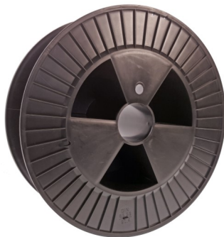
Cod. DIN 300 K20