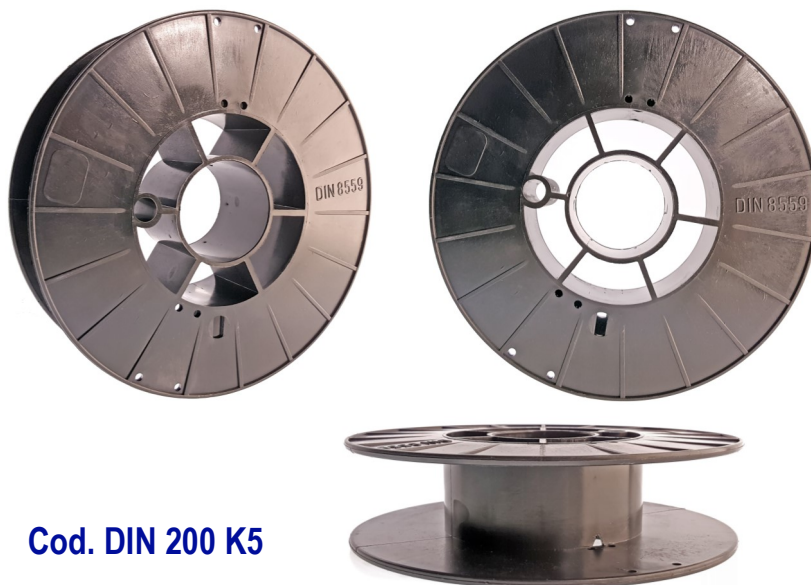
Cod. DIN 200 K5