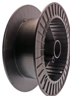
Cod. DIN 300 K15